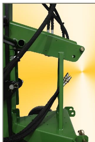
Ausstattung: Hydraulischer Anschluss an Zugmaschine