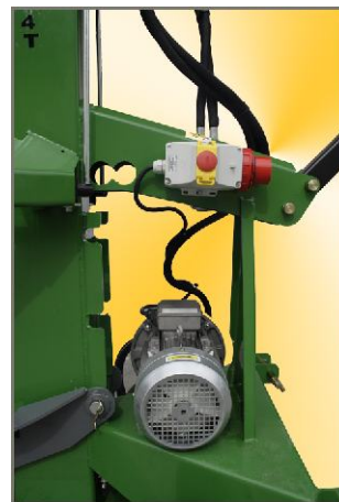
Ausstattung: Dreiphasen Elektromotor