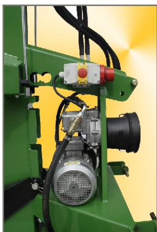
Ausstattung kombiniert: Zapfwellenantrieb Dreiphasen Elektromotor